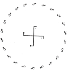
(صفارزاده، ۱۳۶۸: ۶۱)